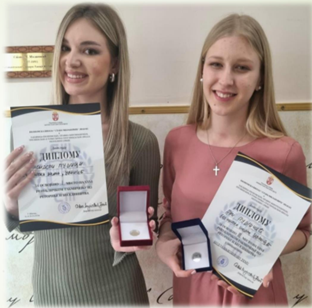
Наши ученици на такмичењима